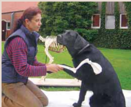
Hundephysiotherapie und -osteopathie