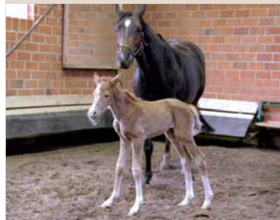
Stutfohlen Welly von Lisa Lou (v. Laomedon, Lauries Crusador)