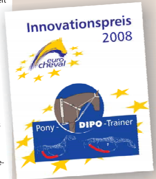
Eurocheval Innovationspreis 2008

DEUTSCHES INSTITUT FÜR PFERDE-OSTEOPATHIE